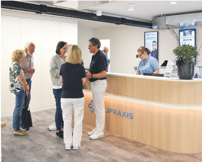
Beim Tag der offenen Tür der «Polipraxis» nutzen die Besucherinnen und Besucher die Gespräche mit den Ärzten und den Medizinischen Praxisassistentinnen.

Mit der neuen «Polipraxis Steckborn AG» ist mehr als nur medizinische Grundversorgung gewonnen und gesichert